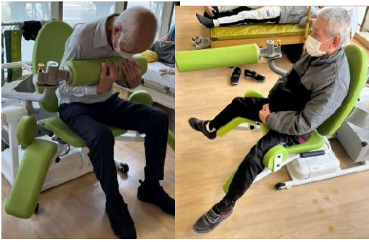
タッチフィットデュオ（1台で2役の役割）

立ち上がり動作に必要なお腹の筋力と歩行に必要な下肢筋力を強化することができます。