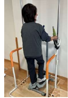
スプリングステッパー