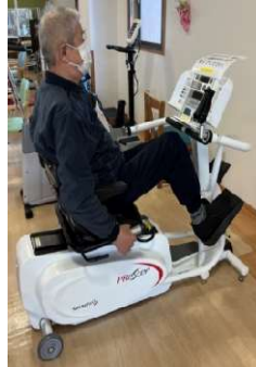
ローイングステッパー