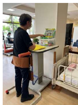
スタンディングテーブル

立つことが難しい方でも、ベルト固定により、一定時間立つことができ、太ももの筋力を鍛えることができます。