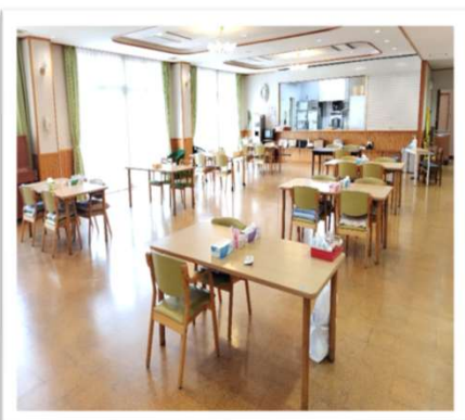
明るく開放的なフロア