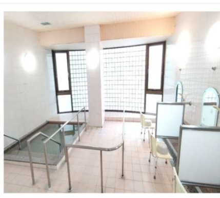
大浴場、小浴場、シャワー室を完備