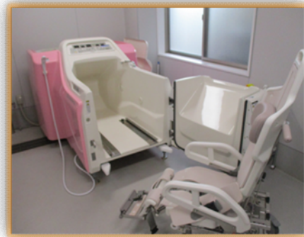
チェアインバス完備