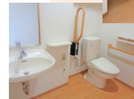
全部屋 トイレあり