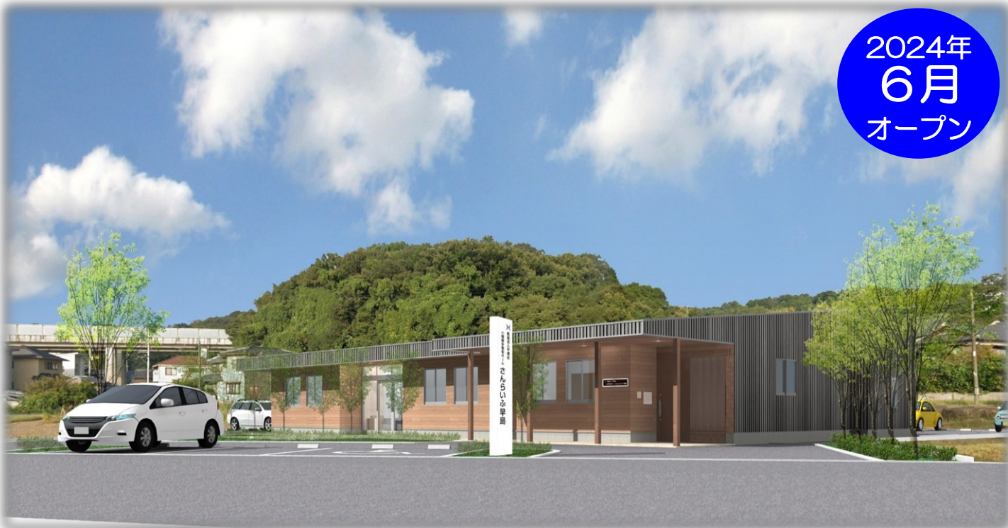
小規模多機能ホームのイメージ図